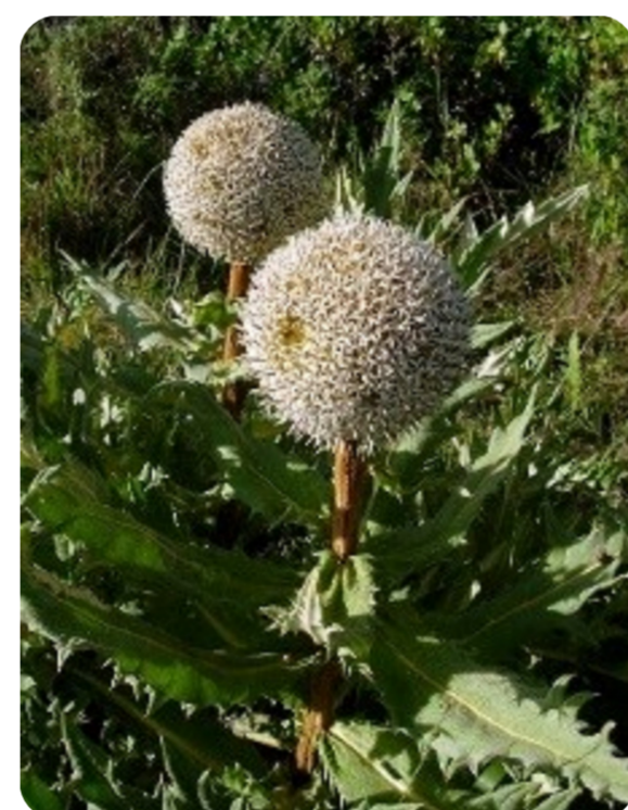
Plante de Echinops gigantes

-Mise en œuvre de projets pilotes de valorisation du matériel génétique d'Echinops gigantes et Mondia white.