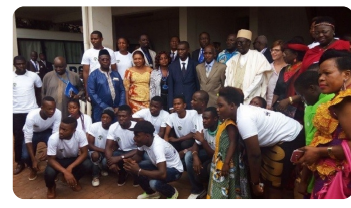
La célébration de la Journée Internationale sur la Diversité Biologique (2016)

-Plus de 1000 «Clubs des Amis de la Nature» ont été créés dans les établissements scolaires des dix régions du Cameroun et encadrés par le MINEPDED