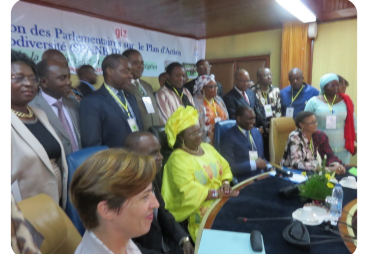
Sensibilisation des Parlementaires sur la Valeur Economique de la Biodiversité

-L'Etat alloue depuis 2014 des fonds à travers le budget d'investissement public (BIP) pour le programme biodiversité du MINEPDED.